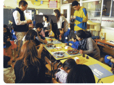
親子でリース作り

保育計画を確立して児童の発達段階に応じて、健康・人間関係・環境・言葉・表現など遊びの中でより充実した保育をめざす。