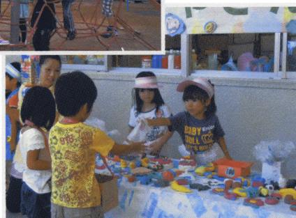
お店屋さんごっこ